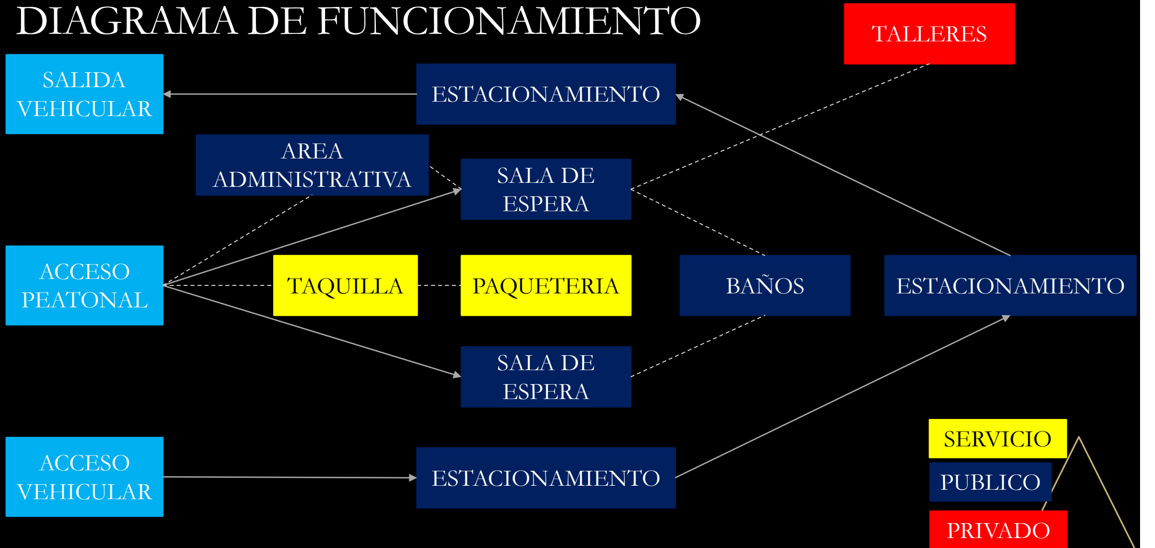
DIAGRAMA DE FUNCIONAMIENTO