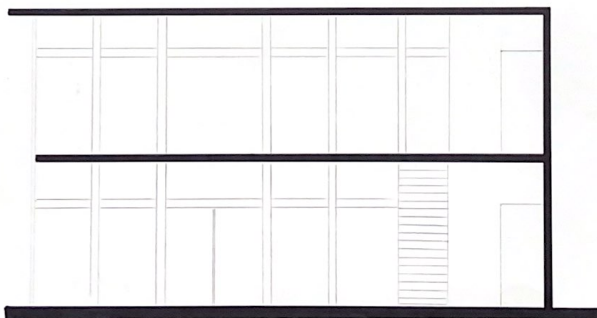
CORTE TRANSVERSAL esc. 1:50