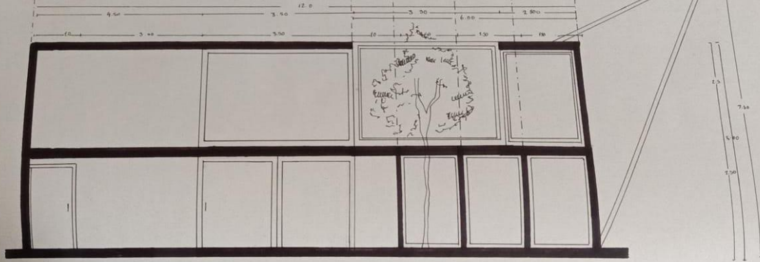
CORTE LONGITUDINAL ESC: 1:50