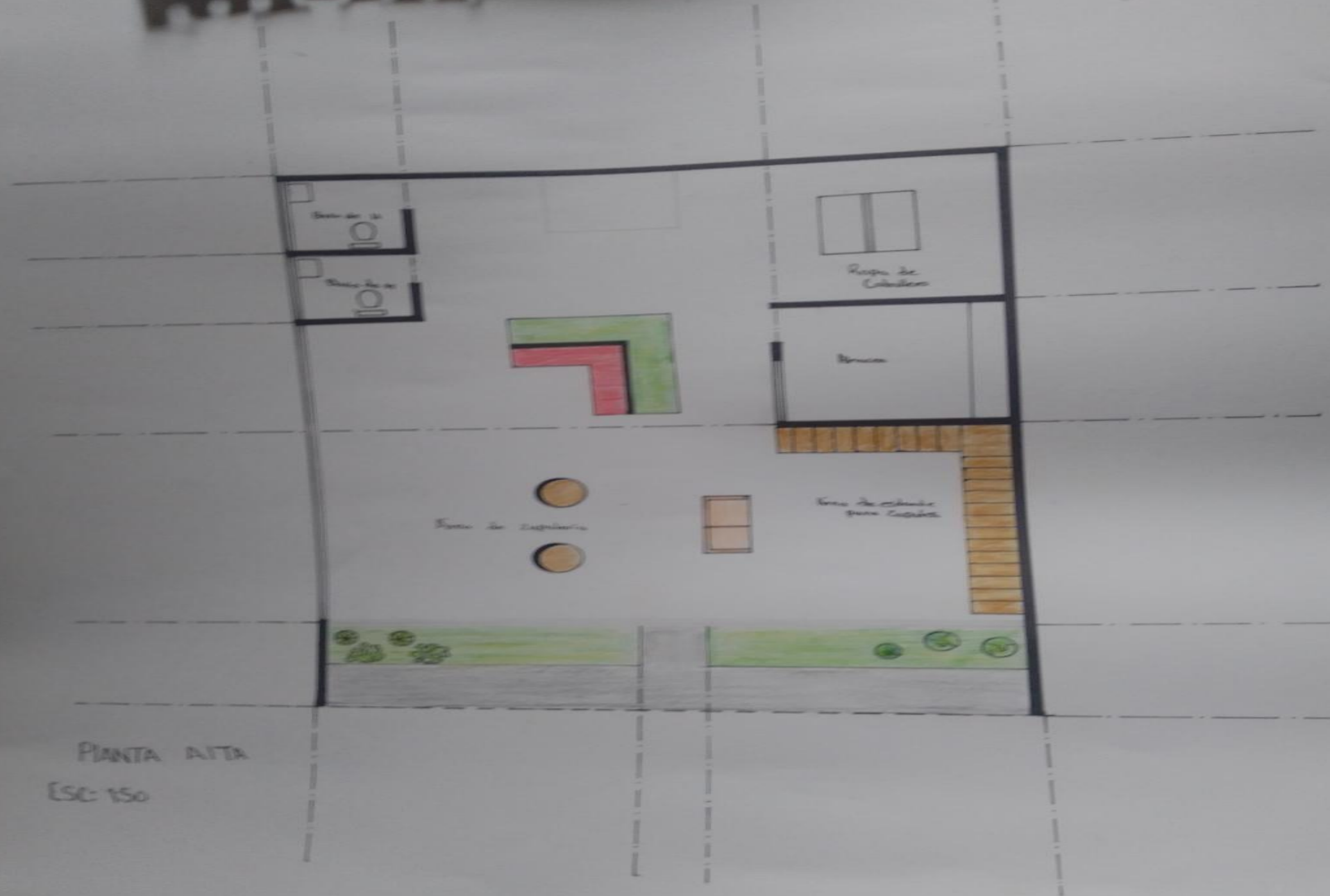
PIANTA ALTA ESC: 1/50