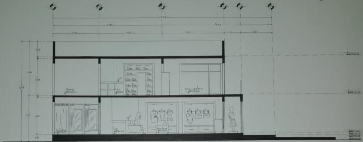
Corte Longitudinal B-B Escala 1:50