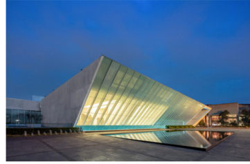
Museo Universitario de Arte Contemporáneo

Ciudad de México, 28 de mayo de 1926, 16 de septiembre de 2016