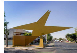
pájaro de fuego

4 de abril de 1915 - Ciudad de México; 4 de agosto de 1990