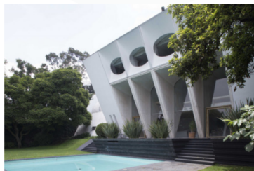
Casa Amalia Hernández

Arquitecto mexicano nacido en la Ciudad de México en 1924