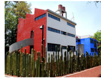
Museo Casa Estudio Diego Rivera y Frida Kahlo

6 de julio de 1905 - 18 de enero de 1982