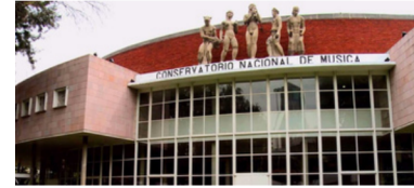
conservatorio nacional de música

Ciudad de México; 29 de marzo de 1911 - 23 de febrero de 1993