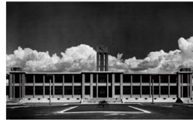
Hospital para tuberculosos

Ciudad de México, 22 de septiembre de 1901, 10 de junio de 1982