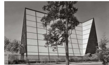
Iglesia de San Ignacio de Loyola

Ciudad de México, 28 de octubre de 1916 , 13 de marzo de 1985