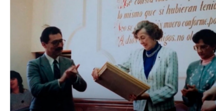
primera arquitecta en titularse en Latinoamérica

Xalapa, Veracruz, 30 de junio de 1912-Ciudad de México, 11 de marzo de 2009