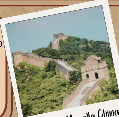
La Gran Muralla China

La creatividad puede ser definida como un proceso mental que consiste en la capacidad de dar existencia algo nuevo, diferente, único y original. Es un estilo de actuar y de pensar, que tiene nuestro cerebro para procesar la información