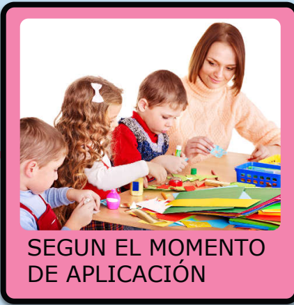
SEGUN EL MOMENTO DE APLICACIÓN

Transmiten la idea de finalización de una etapa o de un ciclo se asocia con frecuencia la evaluación con la conclusión de un proceso aún cuando no sea este el propósito y la ubicación de las acciones evaluativas.