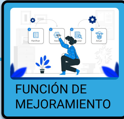
FUNCIÓN DE MEJORAMIENTO

En la recogí de valoración de unos datos al finalizar un período de tiempo previsto para la realización de un aprendizaje. Evaluación final