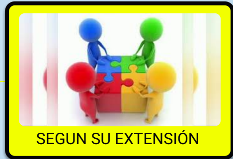
SEGUN SU EXTENSIÓN

Suele aplicarse más en la evaluación de productos Es decir de procesos terminados con realizaciones precisas y valorables.