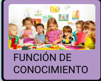
FUNCIÓN DE CONOCIMIENTO

Esta función destaca el aspecto instrumental de la evolución en tanto permite orientar la toma de decisiones hacia la mejora de los procesos o fenómenos objeto de la evolución..