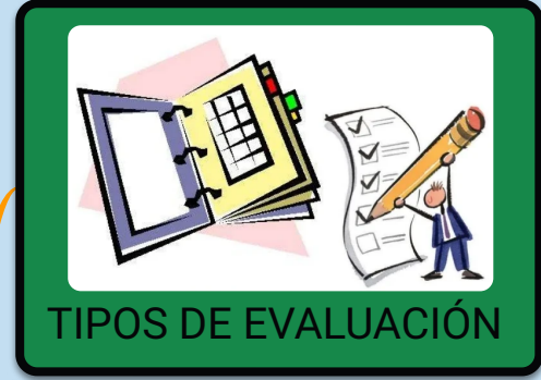
TIPOS DE EVALUACIÓN

En la definición misma de la evaluación y en la descripción de sus componentes identifica como central el rol de la evaluación en tanto herramienta que permite aplicar la comprensión de los procesos complejos.