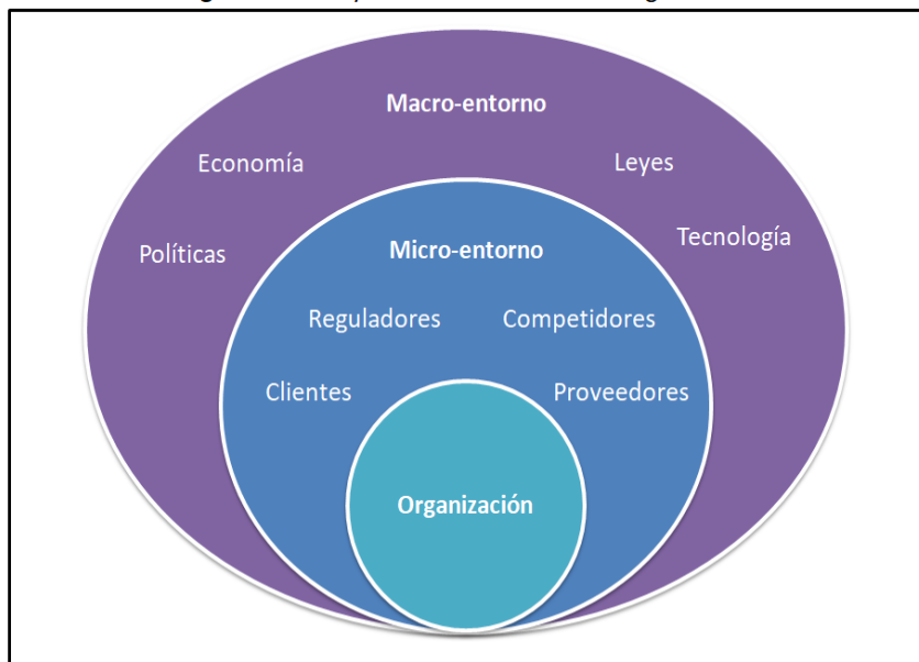
Figura 1. Micro y macro-entorno de una organización

una organización grande, una tecnología de rutina y un entorno estable tienden a crear una organización que tiene mayor formalización, especialización y centralización