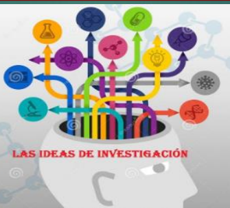
LAS IDEAS DE INVESTIGACIÓN

CONJUNTO DE CONOCIMIENTOS ORGANIZADOS SISTEMATICAMENTE EN UN TODO LOGICO Y COHERENTE