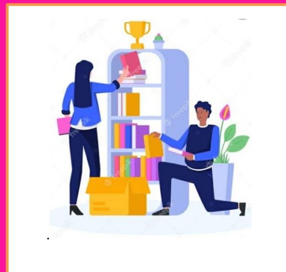
Imagen y prestigio