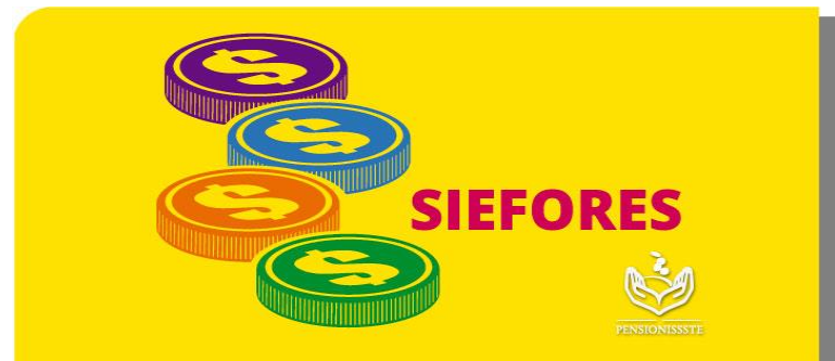
Cuadro 1 Tipos de SIEFORE