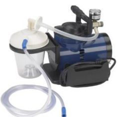
Equipo de Aspiración