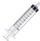
JERINGA 10 ML