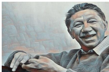
Abraham Maslow (1908 – 1970)