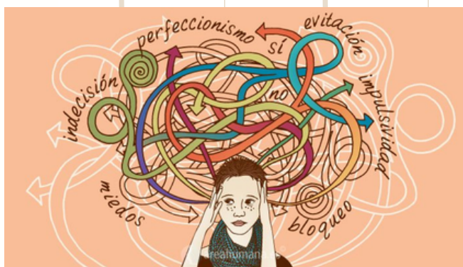
Incapacidad de cambiar