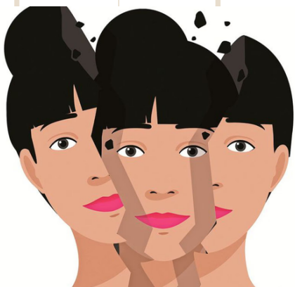
Miedo a ser uno mismo