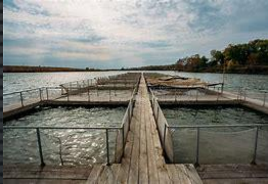
❖ ESTANQUE DE JAULA