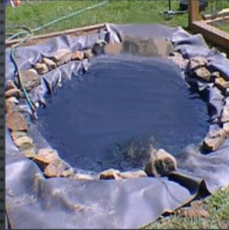
❖ ESTANQUE RUSTICO