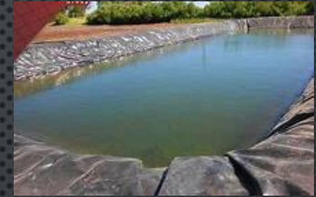
❖ ESTANQUE DE PRESA