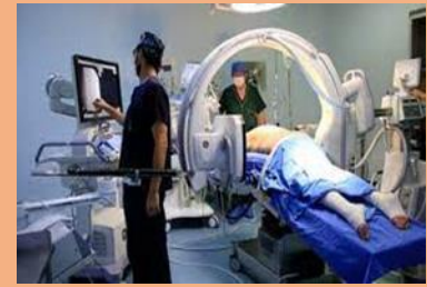
Dentro de este tema es importante