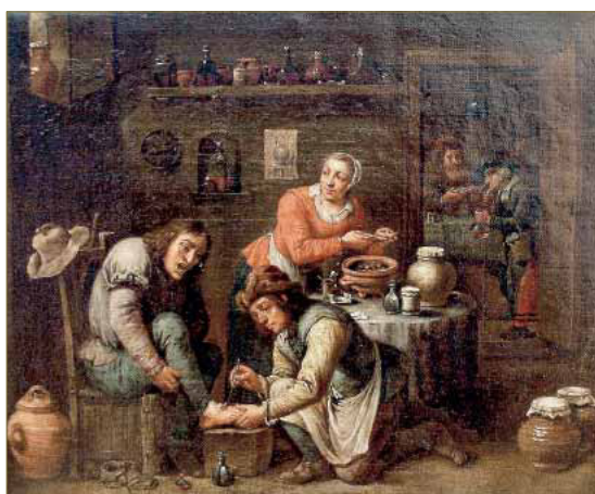
Figura 2. Intervención podológica. Obra de David Teniers el joven (1663) perteneciente a la colección de arte de la Universidad de Göttingen (Alemania).

No obstante, la anatomía aún habría de conquistar nuevos horizontes. Superadas ya las limitaciones teológicas y alcanzando un grado de excelencia en la descripción anatómica, los avances técnicos como el microscopio y las técnicas de estudio por imagen han permitido enriquecer la visión anatómica del cuerpo humano, incorporando paulatinamente los conocimientos histológicos, biomecánicos y fisiológicos para aunar en un mismo concepto no solo la estructura del cuerpo sino también su función. De esta suma de disciplinas científicas deriva la anatomía funcional que trata de explicar forma y función como un todo ya que, como se ha demostrado, existe una íntima relación entre estos dos conceptos en tanto que la forma determina casi siempre la función y ésta, a su vez, va moldeando la forma. Esta cuestión es de capital importancia en Podología, ya que es imposible concebir la función del pie si no se parte de un conocimiento preciso de su rica anatomía al tiempo que es imposible explicar las deformidades que en él se producen sin entender la función biomecánica para la que ha sido diseñado y las fuerzas patomecánicas deformantes que con el paso del tiempo se suceden y van modificando su morfología.