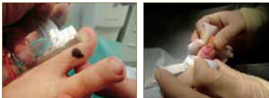
Figura 6. Técnica quirúrgica para la corrección de un nevus melanocítico en una niña de 9 años mediante colgajo de rotación.

En Podología, el conocimiento de los distintos tipos de sutura así como las técnicas y el diseño de diversas plastias es fundamental para un manejo quirúrgico satisfactorio que nos ayudará no solo a cerrar heridas sino también corregir determinadas deformidades y lesiones con un resultado estético y funcional óptimo siempre que se manejen las técnicas adecuadas.