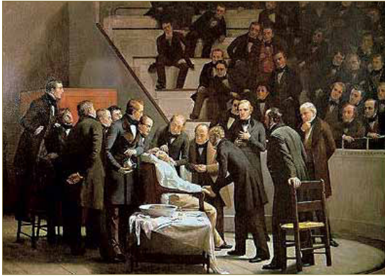
Figura 3. "Anestesia" de Robert Hinckey (1882). Puntura que representa la primera intervención quirúrgica bajo anestesia de la historia. En la imagen, Morton aparece en el centro administrando éter al paciente bajo la atenta mirada de médicos y alumnos en el anfiteatro de Hospital General de Boston, Massachusetts.

Y a punto estuvieron de caer una vez más en el olvido cuando Wells fracasó rotundamente intentando demostrar la eficacia de la sustancia durante una intervención en el Hospital General de Boston, considerado hoy en día como uno de los mejores hospitales del mundo. El joven dentista no había reparado en particularidades respecto al método de administración del anestésico y las características a tener en cuenta en el paciente (peso, edad, consumo de alcohol etc.). Al resultar su intento de demostración fallido, Wells recibió la repulsa general de la escéptica clase médica, lo que le condujo a una serie de acontecimientos que le llevaron a suicidarse tan solo cuatro años más tarde en la que, con toda probabilidad, es la historia más triste dentro de una de las épocas más gloriosas de la medicina.