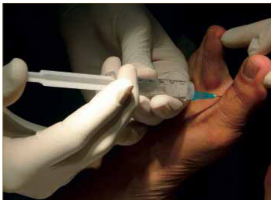
Figura 4. Anestesia local en Podología. El uso de anestésicos locales en Podología facilita el tratamiento de diferentes patologías con seguridad y confort para los pacientes.

racterísticas del paciente a intervenir. El conocimiento de la anestesia, su historia y su uso es básico en la práctica podológica y debe formar parte del arsenal terapéutico de todo podólogo para dar respuesta a diferentes situaciones clínicas con seguridad y favoreciendo el confort de los pacientes.