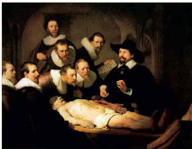
Figura 1. “Lección de anatomía del Doctor Tulp” Rembrandt (1632). Expuesto en el Mauritshuis de La Haya (Holanda).

La primera gran limitación que acució a los cirujanos desde Mesopotamia hasta el Renacimiento pasando por Egipto, Grecia, Roma o Persia, fue el conocimiento impreciso y limitado de la anatomía y la fisiología humana. Bien es cierto que la civilización griega, de la mano de Hipócrates, realizó grandes avances en el conocimiento del cuerpo humano. El heredero de Hipócrates en la civilización occidental sucesora, la romana, fue Galeno. Este médico, de reconocido prestigio e importancia en la historia de la medicina, tiene el dudoso honor de ser también el responsable de numerosas imprecisiones en sus descripciones anatómicas que hubieron de permanecer inamovibles hasta la entrada en escena de los anatomistas universitarios medievales y, sobre todo, de Andrés Vesalio casi 15 siglos después 3 .