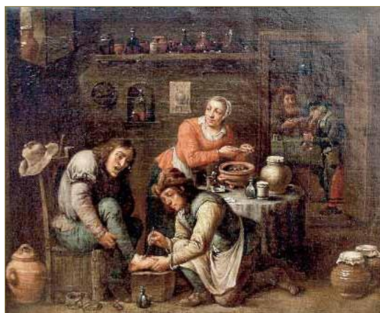
Figura 2. Intervención podológica. Obra de David Teniers el joven (1663) perteneciente a la colección de arte de la Universidad de Göttingen (Alemania).

No obstante, la anatomía aún habría de conquistar nuevos horizontes. Superadas ya las limitaciones teológicas y alcanzando un grado de excelencia en la descripción anatómica, los avances técnicos como el microscopio y las técnicas de estudio por imagen han permitido enriquecer la visión anatómica del cuerpo humano, incorporando paulatinamente los conocimientos histológicos, biomecánicos y fisiológicos para aunar en un mismo concepto no solo la estructura del cuerpo sino también su función. De esta suma de disciplinas científicas deriva la anatomía funcional que trata de explicar forma y función como un todo ya que, como se ha demostrado, existe una íntima relación entre estos dos conceptos en tanto que la forma determina casi siempre la función y ésta, a su vez, va moldeando la forma. Esta cuestión es de capital importancia en Podología, ya que es imposible concebir la función del pie si no se parte de un conocimiento preciso de su rica anatomía al tiempo que es imposible explicar las deformidades que en él se producen sin entender la función biomecánica para la que ha sido diseñado y las fuerzas patomecánicas deformantes que con el paso del tiempo se suceden y van modificando su morfología.