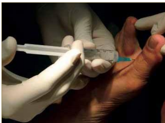
Figura 4. Anestesia local en Podología. El uso de anestésicos locales en Podología facilita el tratamiento de diferentes patologías con seguridad y confort para los pacientes.

racterísticas del paciente a intervenir. El conocimiento de la anestesia, su historia y su uso es básico en la práctica podológica y debe formar parte del arsenal terapéutico de todo podólogo para dar respuesta a diferentes situaciones clínicas con seguridad y favoreciendo el confort de los pacientes.