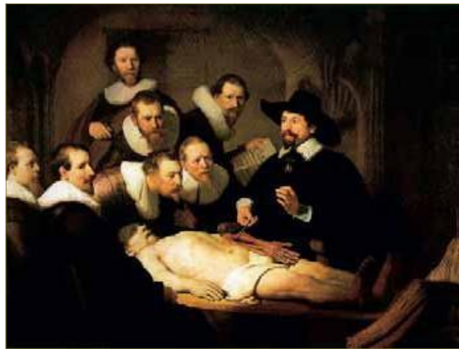
Figura 1: “Lección de anatomía del Doctor Tulp” Rembrandt (1632); Expuesto en el Museo Mauritshuis, de La Haya (Holanda).

La primera gran limitación que acució a los cirujanos desde Mesopotamia hasta el Renacimiento pasando por Egipto, Grecia, Roma o Persia, fue el conocimiento impreciso y limitado de la anatomía y la fisiología humana. Bien es cierto que la civilización griega, de la mano de Hipócrates, realizó grandes avances en el conocimiento del cuerpo humano. El heredero de Hipócrates en la civilización occidental sucesora, la romana, fue Galeno. Este médico, de reconocido prestigio e importancia en la historia de la medicina, tiene el dudoso honor de ser también el responsable de numerosas imprecisiones en sus descripciones anatómicas que hubieron de permanecer inamovibles hasta la entrada en escena de los anatomistas universitarios medievales y, sobre todo, de Andrés Vesalio casi 15 siglos después 3 .