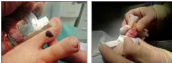
Figura 6. Técnica quirúrgica para la corrección de un nevus melanocítico en una niña de 9 años mediante colgajo de rotación.

En Podología, el conocimiento de los distintos tipos de sutura así como las técnicas y el diseño de diversas plastias es fundamental para un manejo quirúrgico satisfactorio que nos ayudará no solo a cerrar heridas sino también corregir determinadas deformidades y lesiones con un resultado estético y funcional óptimo siempre que se manejen las técnicas adecuadas.