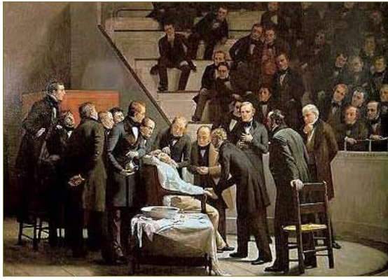
Figura 3. "Anestesia" de Robert Hinckley (1882). Pintura que representa la primera intervención quirúrgica bajo anestesia de la historia. En la imagen, Morton aparece en el centro administrando éter al paciente bajo la atenta mirada de médicos y alumnos en el anfiteatro de Hospital General de Boston, Massachusetts.

Y a punto estuvieron de caer una vez más en el olvido cuando Wells fracasó rotundamente intentando demostrar la eicacia de la sustancia durante una intervención en el Hospital General de Boston, considerado hoy en día como uno de los mejores hospitales del mundo. El joven dentista no había reparado en particularidades respecto al método de administración del anestésico y las características a tener en cuenta en el paciente (peso, edad, consumo de alcohol etc.). Al resultar su intento de demostración fallido, Wells recibió la repulsa general de la escéptica clase médica, lo que le condujo a una serie de acontecimientos que le llevaron a suicidarse tan solo cuatro años más tarde en la que, con toda probabilidad, es la historia más triste dentro de una de las épocas más gloriosas de la medicina.