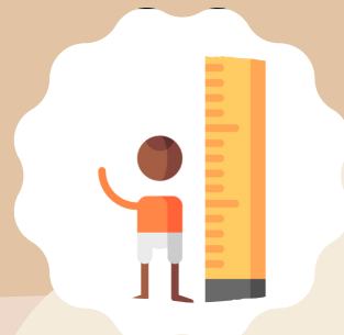
PROBLEMAS DE CRECIMIENTO