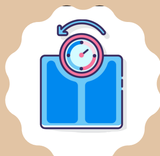
PERDIDA DE PESO