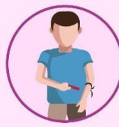
Intercambio de agujas