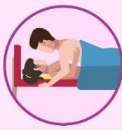
Relaciones sexuales sin protección