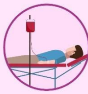
Transfusión de sangre