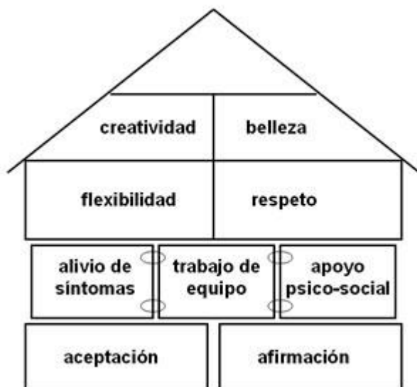
Figura 1. La casa de los hospicios