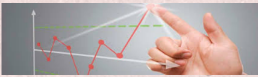
grafico o diagrama de control

un grafico de control es una herramienta utilizada para distinguir las variaciones debidas a causas asignables o especiales a partir de las variaciones aleatorias inherentes al proceso las variaciones debidas a causas asignables o especiales indican que es necesario indentificar , investigar y poner vajo control algunos factores que afecta al proceso