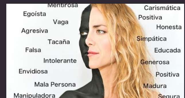
imagen ideal vs imagen proyectada: como todo aquel proceso de cambio físico-psicológico, que aplicamos en nosotros de manera individual

imagen ideal : Es una proyección de lo que quieres ser y todavía no has alcanzado