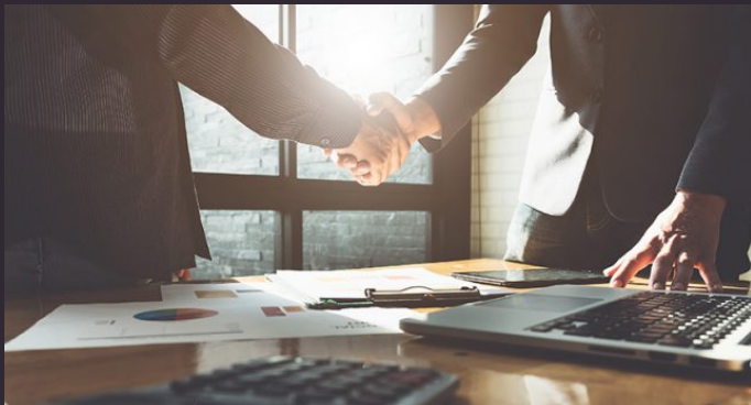
imagen proyectada: Representa lo que eres hoy con tus imperfecciones y virtudes.

asertividad: expresar sentimientos, opiniones y pensamientos, en el momento oportuno