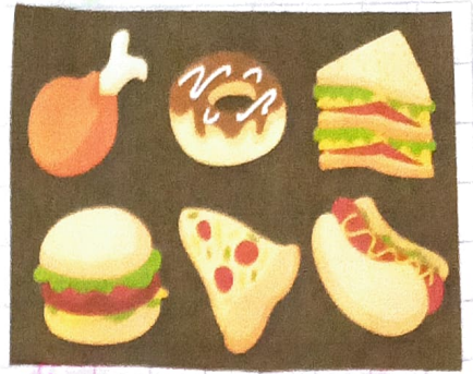
Alimentación no adecuada.