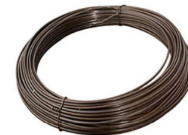
5. materiales metálicos