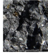
Basalto. Roca volcánica. De color oscuro, compacto, denso, duro, muy resistente.