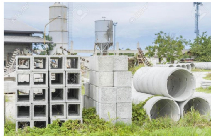
4. Pétreos aglomerados de arcilla.