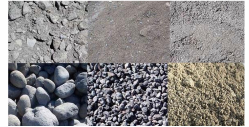
2. Clasificación de los materiales