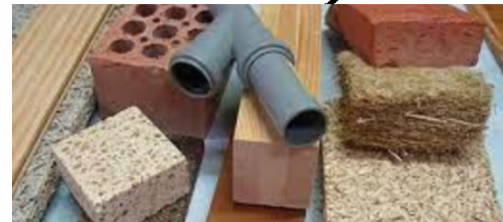
1. Concepto de materia, material y material de construcción