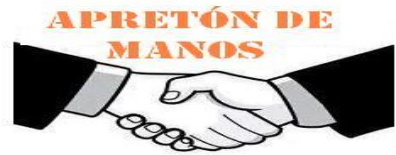
APRETÓN DE MANOS