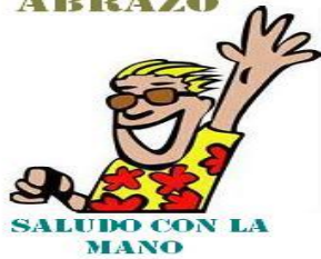
SALUDO CON LA MANO