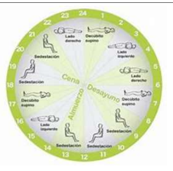
Sistema de Clasificación de las Úlceras por Presión