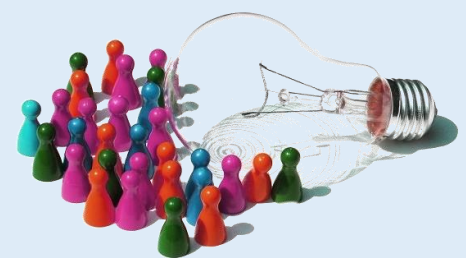
10.- Recursos y potencialidades