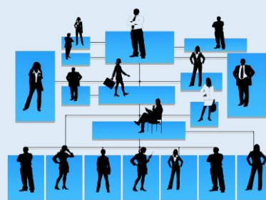
7.- Organización social