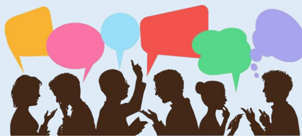
9.- Percepción del cambio social