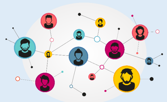
8.- Procesos sociales