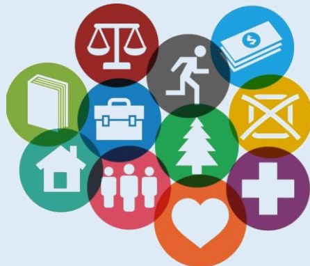
6.- Niveles de vida