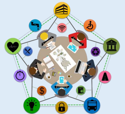
4.- Infraestructura y equipamiento