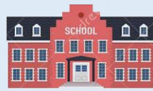
3.- Estructuras físicas fundamentales