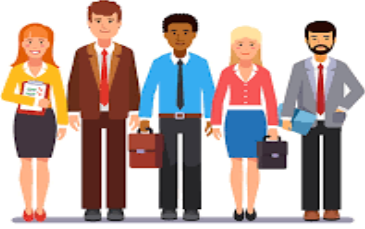
Imagen Y Desarrollo De Sus Componentes

Conceptos básicos e importancia de la imagen, los ojos reciben una serie de estímulos estos entran a través de la rutina pasan por el nervio óptico y son procesadas y analizadas.