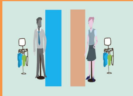
Imagen personal nos referimos a un tema muy amplio que abarca desde los rasgos físicos y forma de vestir hasta la postura y movimientos al sentarse caminar y saludar.

Imagen profesional está relacionada directamente con la disciplina de la imagen pública que abarca la identidad.