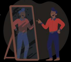
Imagen no verbal

Aprecio auténtico de uno mismo como ser humano