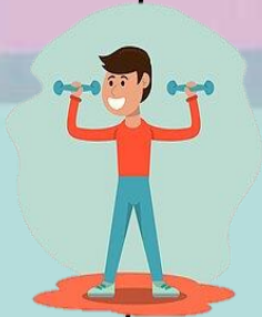
IMAGEN Y DESARROLLO SE SUS COMPONENTES