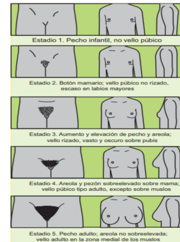
Figura 2-7. Calificación Tanner femenina.