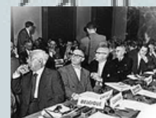
Declaración Helsinki de 18ª Asamblea Médica Mundial en 1964