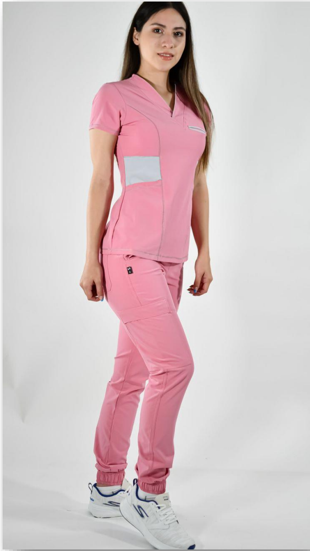
IMAGEN Y VESTIMENTA PARA MUJERES