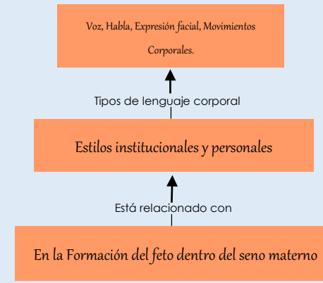
IMAGEN Y DESARROLLO DE SUS COMPONENTES