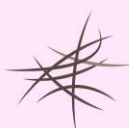
Caída del cabello