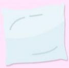
Alteraciones del sueño

Los síntomas principales son la ausencia de la menstruación, dolor de cabeza, acné, exceso de vello facial y secreción de leche por el pezón.