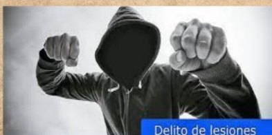
Delito de lesiones

Los profesionales de la salud tienen la obligación de asistir y atender a las personas cuya vida se encuentre en peligro, teniendo en cuenta que el fin supremo de esta profesión es preservar la vida humana, por lo que queda bajo su responsabilidad la protección de la vida y la salud del paciente