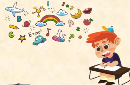
Plan de cuidados.