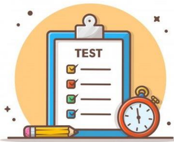
Imagen 7 recuperado de: https://www.pinterest.com.mx/pin/720294534171195430/