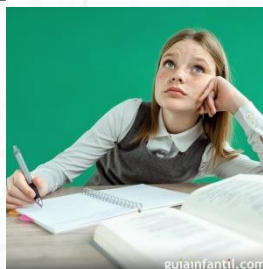
Imagen 7