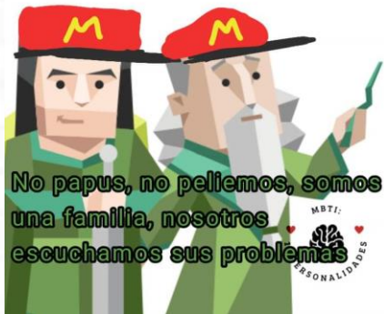
Imagen 8 Recuperado de: https://www.facebook.com/107570138253805/posts/pfbid0351AP4DCFGwDSR3cdYuQnF1zLjudyHpcNDefzmKtDom5yNDKBNddzdV9WpbnxCB7/?sfnsn=scwspmo&mibextid=RUBz1f

But llegan los licenciados en psicología: