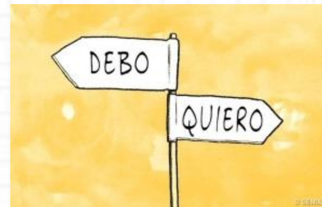
Imagen 5