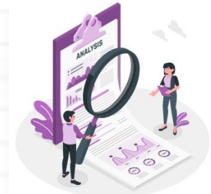
Imagen 4