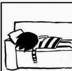
Imagen 6