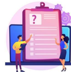
Imagen 3