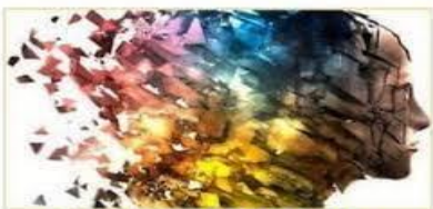
LOS MODELOS DE LA PSICOLOGÍA CLÍNICA

Las mismas características que se consideran como ventajas principales de los modelos clínicos también pueden presentarse como sus desventajas fundamentales.