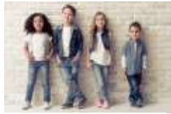
Niños de 7_11