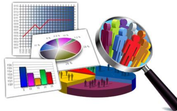
Etapas de la investigación científica https://www.auniv.com/s/blog/etapas-y-proceso-de-la-investigacion-cientifica/