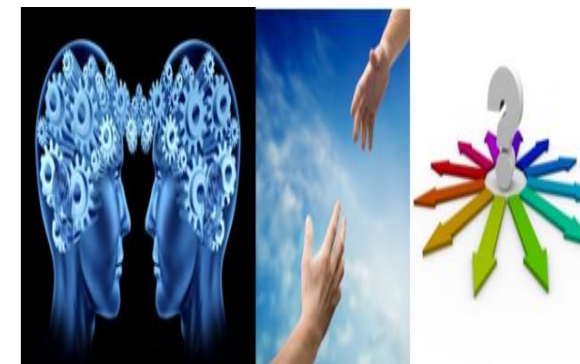
Importancia de la investigación científica https://metodologiainvestigacionunivia.wordpress.com/2012/04/04/1-importancia-y-metodos-de-la-investigacion-cientifica/