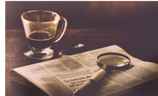
Tipos de investigación científica https://cuadros-comparativos.com/investigacion-cientifica-caracteristicas-y-tipos/