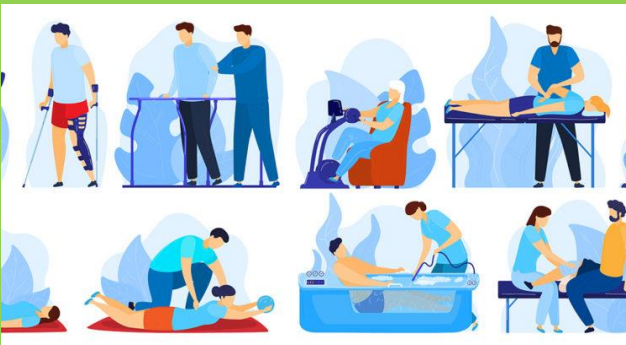
fisioterapia analítica y global