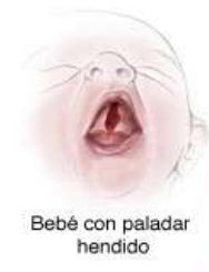
Bebé con paladar hendido

LABIO LEPORINO BILATERAL cortes a ambos lados del labio