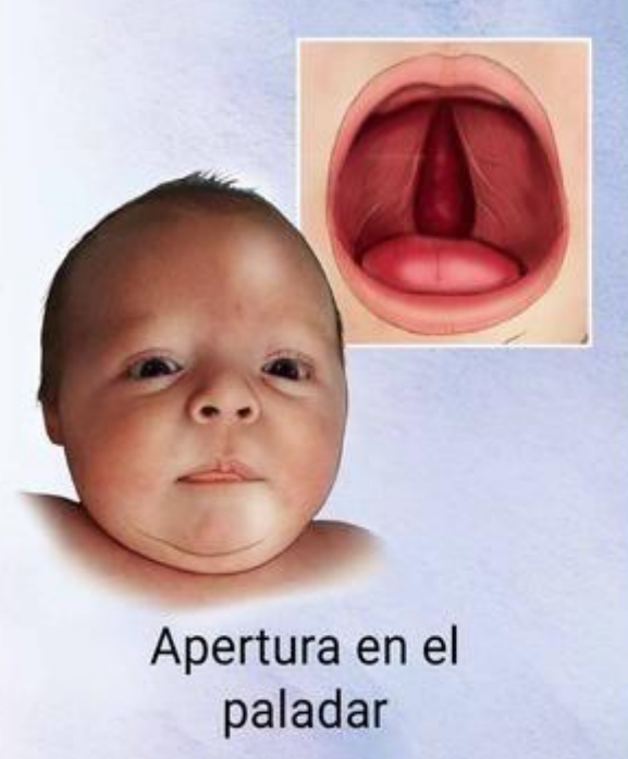
Apertura en el paladar