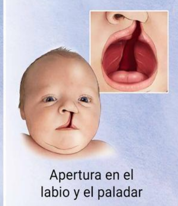
Apertura en el labio y el paladar