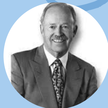
PHILIP B. CROSBY

Philip B. Crosby está más estrechamente asociado con la idea de “cero defectos” que él creó en 1961. Para Crosby, la calidad es conformidad con los requerimientos, lo cual se mide por el coste de la no conformidad.