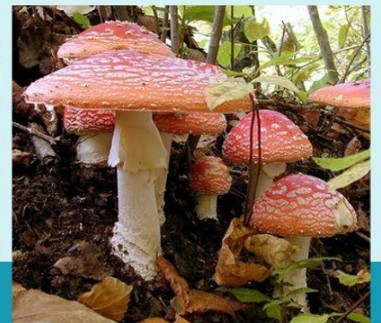
LENGUA DE VACA TROMPETA DE LOS MUERTOS OREJA DE JUDAS PEDO DE LOBO GALLIPIERNO MATAMOSCAS TRAMETES VERSICOLOR HONGO YESQUERO BERMELLÓN ESTRELLA DE TIERRA