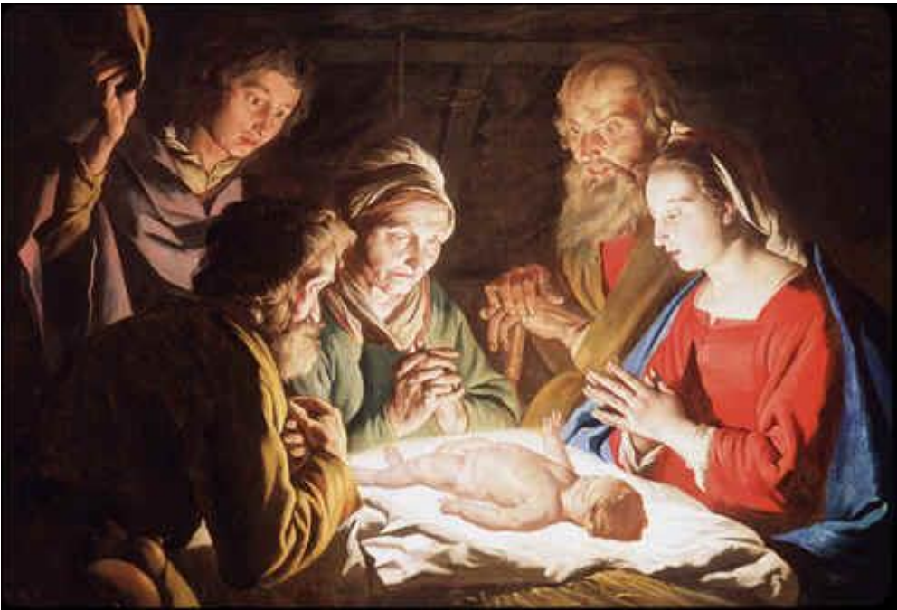
Adoración de los Pastores Mathias Stomer (1635-40)

La navidad es una de las celebraciones más importantes en todo el mundo. Es un hito importante para nosotros, el final de un año, tiempo de regalos, festejos, reuniones familiares y –para los cristianos practicantes- una emotiva fiesta religiosa.